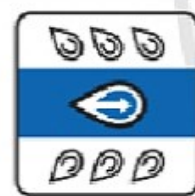
TIÊU THOÁT NƯỚC