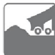
BÃI RÁC THẢI