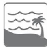
BỜ SÔNG, BỜ BIỂN