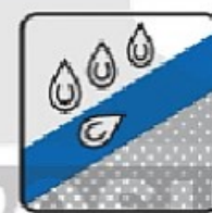
CHỐNG XÓI MÒN