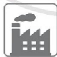
KHU CÔNG NGHIỆP, NHÀ MÁY